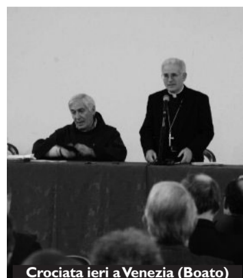
Crociata ieri a Venezia (Boato)

I n una società plurale come quella italiana, non c'è scampo all'esigenza di «imparare a conoscersi e conoscersi», in una circolarità destinata a rafforzare l'esperienza della fede vissuta nella comunità ecclesiale, la relazione con il diversamente credente, la possibilità di farsi costruttori di una comunità umana arricchita dall'apporto di una diversità che fa crescere il bene di tutta la collettività». Se n'è dichiarato convinto il vescovo Mariano Crociata, segretario generale della Cei, svolgendo la prolusione del nuovo anno accademico dell'Istituto di studi ecumenici San Bernardino, a Venezia.